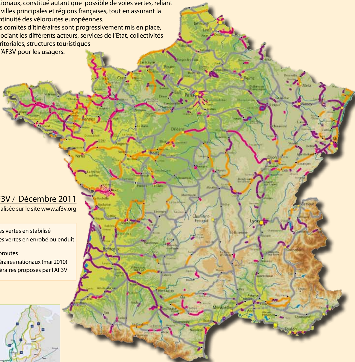
Carte AF3V / Décembre 2011 version actualisée sur le site www.af3v.org

Des comités d'itinéraires sont progressivement mis en place, associant les différents acteurs, services de l'Etat, collectivités territoriales, structures touristiques et l'AF3V pour les usagers.